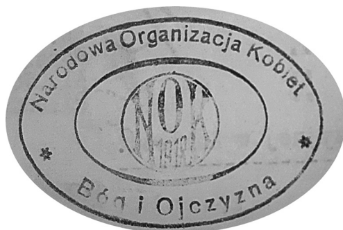
Pieczęć NOK z 1918 r.

1919 r. 9 Źródła archiwalne przynoszą informację, że początki działalności stowarzyszenia sięgają już roku 1918. Z tego też roku pochodzi pierwsza pieczęć organizacji.