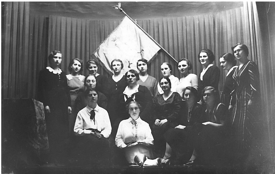
Fotografia członkiń NOK, oddział w Kaliszu. Ze zbiorów Książnicy Pedagogicznej im. A. Parczewskiego w Kaliszu