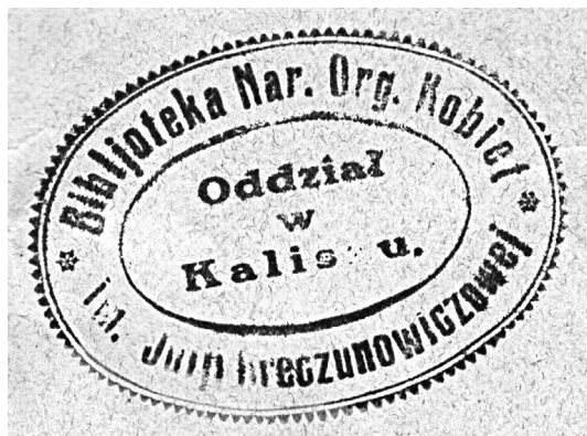
Pieczęć Biblioteki im. Julii Kreczunowiczowej NOK oddział w Kaliszu.

Siedziba oddziału kaliskiego NOK mieściła się początkowo przy ulicy Warszawskiej 5, następnie Warszawskiej 20, zaś w latach 30. XX w. – przy Alei Józefiny 8 35 , od 1935 r. przy Alei Aleksandry Piłsudskiej 8. W ramach stowarzyszenia działało kilka sekcji 36 : sekcja dochodów niestałych urzędowała dancingi i rozgrywki szachowe; sekcja biblioteczna prowadziła bezpłatną wypożyczalnię książek 37 ; sekcja sztandarowa brała udział w uroczystościach religijnych i narodowych; sekcja rozrywkowa urzędowała wycieczki, majówki,