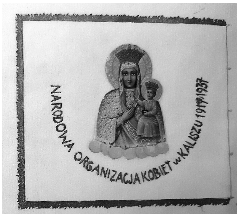
Projekt sztandaru NOK oddział w Kaliszu.