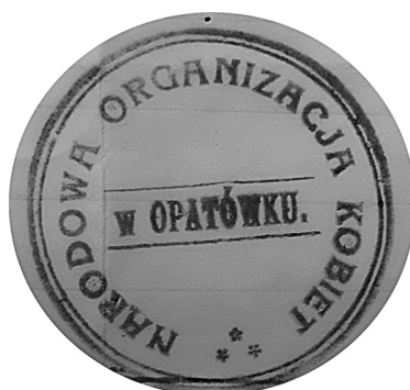
Pięczętka NOK, oddział w Opatówku