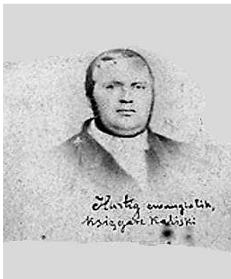
Portret Henryka Hurtiga; zbiory Muzeum Okręgowego Ziemii Kaliskiej w Kaliszu