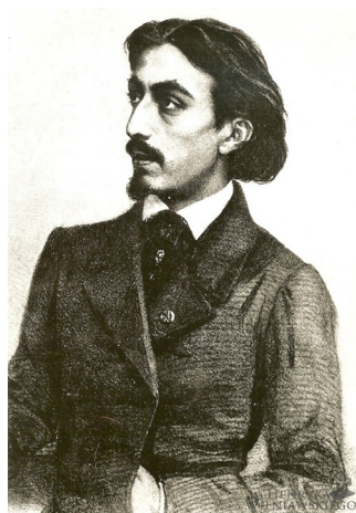
Henryk Wieniawski, litografia Louisa-Josepha Ghemara, ok. 1857

istnienia i wydania w oficynie Hurtiga jeszcze jednego utworu Wieniawskiego – Kujawiaka C-dur . Informację tę podają zarówno niektóre hasła encyklopedyczne, jak i autorzy monografii kompozytora. W biogramie Wieniawskiego w Słowniku muzyków polskich 3 , Małej encyklopedii muzyki 4 i w Encyklopedii muzyki 5 , wymienione są dwa Kujawiaki bez oznaczenia numeru opusu: C-dur i a-moll. Oba miały być wydane w 1853 roku. Józef Reiss, autor pierwszej polskiej monografii kompozytora, pisze o istnieniu dwóch Kujawiaków z tego samego roku 6 . Władimir Grigoriew także wymienia dwa tego typu utwory powstałe w tym samym czasie. Autor podaje, że Kujawiak C-dur , napisany w 1852 roku, został wydany w 1853 roku właśnie w Kaliszu u Hurtiga 7 . Natomiast w dwóch innych opracowaniach biografii i dorobku twórczego Wieniawskiego, autorstwa I. Jampolskiego 8 i G. Jantarskiego 9 , wśród utworów wydanych bez numeru opusu figuruje tylko jeden Kujawiak ,