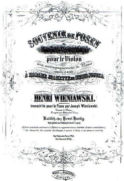
Strona tytułowa Souvenir de Posen op. 3 Henryka Wieniawskiego, aranżacja na fortepian solo Józefa Wieniawskiego, pierwodruk Henryka Hurtiga w Kaliszu; zbiory Biblioteki Uniwersyteckiej w Poznaniu

w wersji na skrzypce i fortepian oraz fortepianowej 28 . Wydaje się, że jest to jedno z wcześniejszych jego wydań, może nawet dopiero drugie. Podobnie jak pierwodruk, i tym razem Souvenir wydrukowano w renomowanej lipskiej firmie drukarskiej C.G. Röder (zał. 1846), z którą współpracowało wielu czołowych wydawców muzykaliów. Warto na marginesie wspomnieć, że w drukarni tej powstało szereg edycji dzieł polskich kompozytorów, zwłaszcza z końca XIX i 1. połowy XX wieku, m.in. Karola Szymanowskiego 29 . Jest rzeczą znaną, że w początkach XX wieku pojawiło się aż kilka wydań opusu 3 Wieniawskiego. W edycjach przodowały oficyny niemieckie, ale np. w 1900 roku amerykański Schirmer opublikował Souvenir w Nowym Jorku. Właśnie w tamtych czasach kompozycje Wieniawskiego, nawet te mniej znane i nieco mniejszej rangi artystycznej, cieszyły się znaczną popularnością